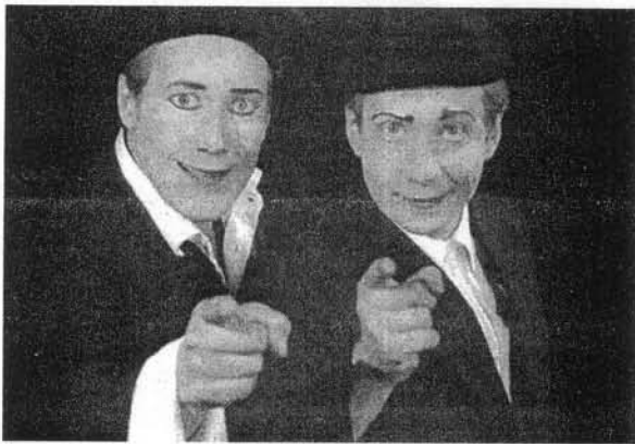
El espectáculo está cargado de ilusionismo e imaginación